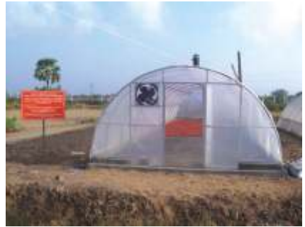
kps fha:fhai t j j y;