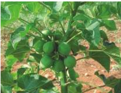
fhl j hkz fF jhtuk;