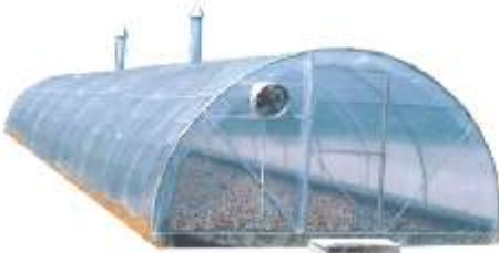
nj' fha:fhai t j j y;