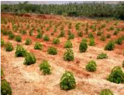
fhl j hkz fF njhl j k;